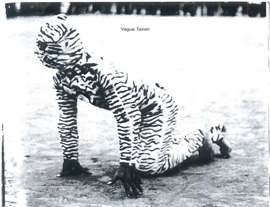
Juego ancestral Chiriguano, Bolivia, El Jaguar y el Toro.