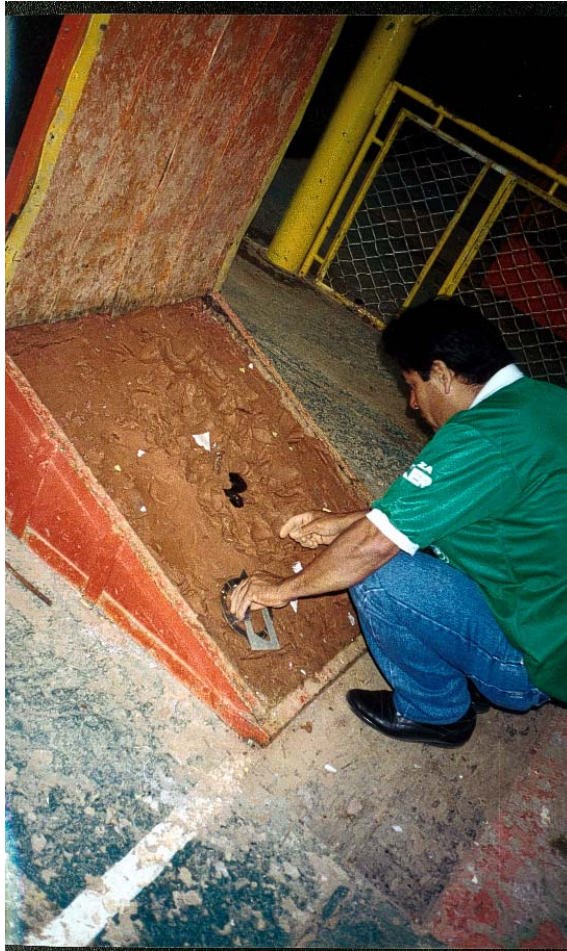
Tumerke versión moderna del ancestral juego Chibcha jugado con discos de oro. Colombia .Actualmente le llaman Tejo.