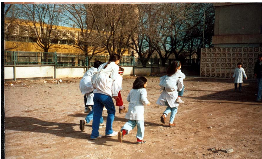
Taller de capacitación en el B.O.P. del Colegio San Martín, Nivel Medio, Neuquén, 1992 Estudiantes del taller de Educación y Cultura Mapuche enseñan juegos al alumnado de dicha escuela del Nivel Primario.

Espero que algún día en la clase de Educación física sea normal ver al alumnado participar en juegos de sus propias identidades étnicas, y compartiendo los juegos de otras etnias. De esta manera crearemos una sociedad que respete la diversidad étnico cultural.