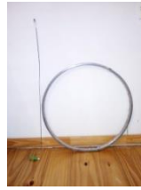
Aro con alambre para correr que puede utilizarse sin ella