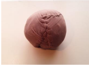
Recrear otras épocas y juguetes enseña a valorar y también divierte.