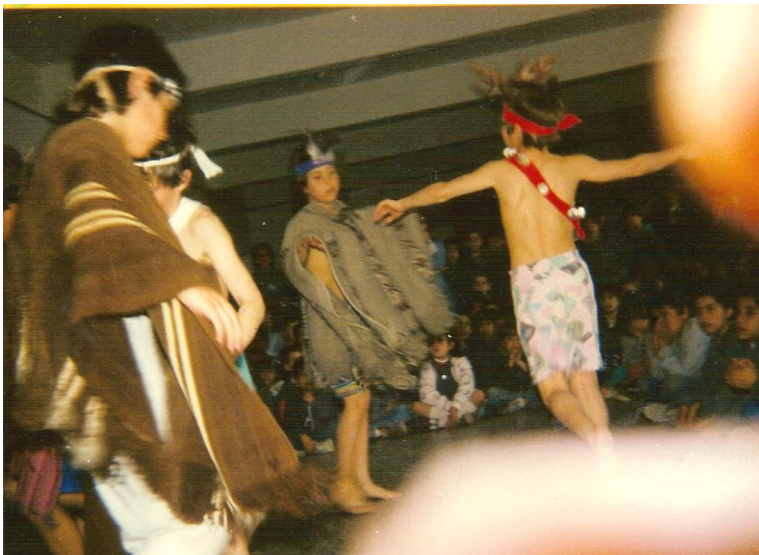
Foto del homenaje realizado al Pueblo mapuche por alumnos / as de 4to. Grado del turno tarde del Colegio Don Bosco de Neuquén, Octubre, 1992

En esa identidad surge la cultura o el folklore. Ambos son sinónimos, solo que folklore (“saber del pueblo”) fue desplazado por cultura (“lo que el ser humano/pueblo produce”) por algunos grupos económicos de poder occidentales hace unos cuantos decenios con el fin de diferenciarse de otros grupos humanos. Todos poseemos cultura 1 por lo que la palabra culto/a esta mal utilizada. Todas las personas somos cultas porque poseemos cultura.