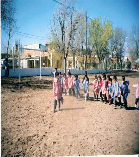
Inserción del juego "El Pato" (Chiriguano) en el Nivel Inicial Escuela Primaria Común Nº1 Turno mañana 2002.