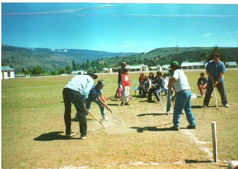
Implementación de los ancestrales Juegos Indoamericanos Año 1999 Lago Rosario, Chubut Comunidad tehuelche- Mapuche.

Los Pueblos Originarios de América jugaban juegos creados con fines religiosos, unos, y sociales otros. A veces un mismo juego podía ser jugado en diferente contexto lo que le daba su carácter de