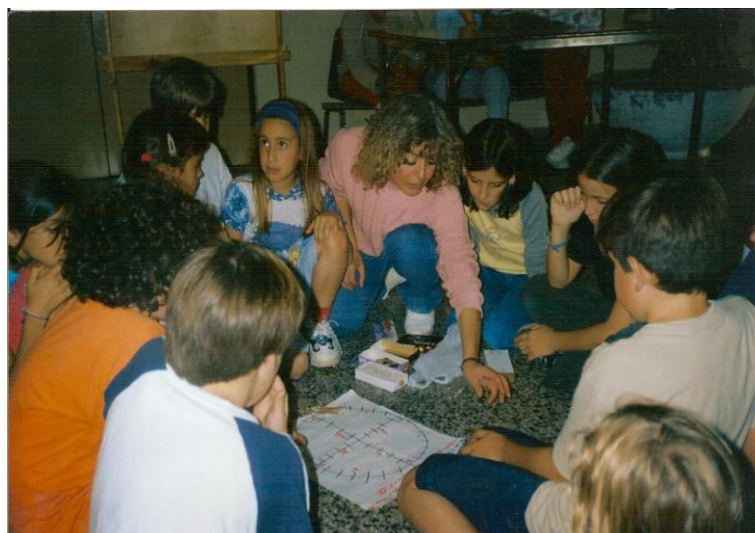
Foto: taller de Juegos étnicos americanos para alumnos / as de los 4tos. y 5tos. Grados como parte de los festejos pro los 30 años de la Universidad Nacional del Comahue, 6 y 12 de abril del 2003.

Plantea la importancia del juego en la escuela desde lo cognitivo y lo afectivo-emocional. Por esto todo lo aplicable al concepto juego es aplicable al concepto juego étnico lo que indica que el jugar estos juegos el beneficio será para toda la niñez que lo practique además del agregado que poseerá para los/as niños/as diferentes étnicamente si sus juegos ingresan en las escuelas. Al mismo tiempo esto permitirá que la educación sea