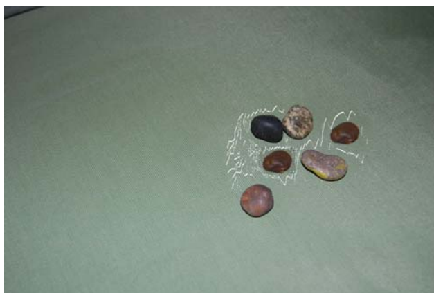
Foto 3 Piedras utilizadas para jugar Allimllim

Los registros indican el uso de piedras pequeñas para jugarlo. La cantidad son 6 piedras. Cada jugador/a usa sus seis piedras (Foto 3). El juego se hace primero con una mano y luego con la otra, cuatro veces. El significado de esta repetición es para adquirir destreza con la mano, y el juego usando las dos manos es para adquirir temple en el carácter. Al momento de iniciar el juego cada uno/a elige con que mano iniciará el mismo. Actualmente se mantiene ese modo de juego pero se desconoce el significado. En nuestro trabajo de reinsertión explicamos y analizamos esto con los pobladores del subproyecto “Cuentan los Abuelos”.