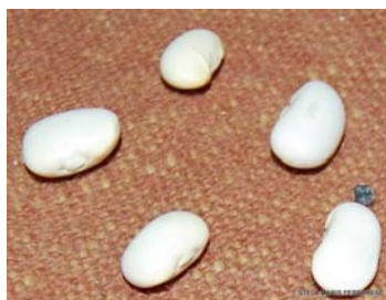
Foto 1 Porotos Pallar con que originalmente se jugaba pallana vi

Este juego sin ser originario mapuche (por su nombre) era jugado por ellos. El juego pallana ya lo había registrado en otras partes del país como juego infantil indígena en práctica en zonas rurales de la provincia de Salta pero también en zonas urbanas practicado por niñas y niños de origen étnico no indígena (de alguna etnia que vive en algunos de los países europeos que las aglutinan)