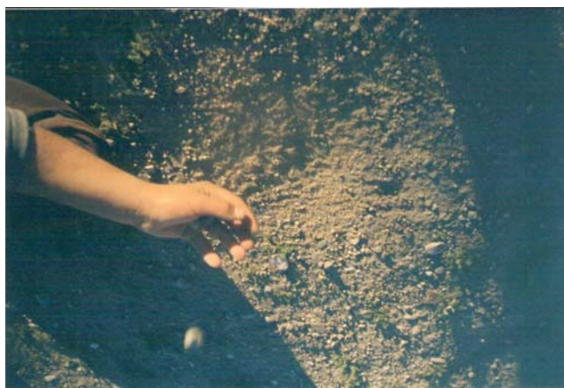
Lanza la piedra peloteadora al aire (en Maquinchao, Pcia. de Río Negro, Argentina 2002)

En mi trabajo de revisión bibliográfica en Argentina no encontré ningún dato sobre este juego. Todos los registros señalaban a la pallana como juego extendido entre los gñua kene y los mapuche en Argentina. Martínez Crovetto (1969:11) nombra un juego denominado “añilwe”, también llamado “echif Kurrá” indicando (...) del juego de la “payana”..... pero en ninguna de sus investigaciones cita el Allimllim. Manquilef en cambio no nombra, en su trabajo, estos dos juegos Sólo en una publicación que realiza, de su libro, la revista de Folklore chileno cita el juego “pallana”, como similar al indicado por Flores en “juegos de Bolitas” (Rev. De Fol. Chileno II p- 86-87, Anales de la Universidad – Tomo 128 – 28- 29/68) Al parecer el mismo juego se podía jugar con semillas de diferentes frutos.