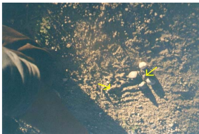
Inicio con las seis piedras en el suelo (foto de la autora en Maquinchao, Pcia. de Río Negro, Argentina 2002)

El juego se inicia arrojando las seis piedras al aire, según Manquilef, y se trata de recibir la mayor cantidad de piedras en el dorso de la mano. Luego se tiran las seis piedras en el suelo y con una elegida se pelotean las otras de a una por vez hasta que se hayan levantado las cinco del suelo. Cada vez que se levanta una de suelo con la que viene en descenso se deja apartada de las que aun restan levantar. Ese juego- ejercicio se repite cuatro veces con la mano elegida para adquirir flexibilidad. Luego se repite con la otra mano. Los puntos se dan por la cantidad de piedras que se juntan sobre el dorso de la mano cada vez que se hace. Al realizarse 4 veces con cada mano, ocho en total, se suman la cantidad de piedras que se han recogido en el dorso cada vez. Esto proporciona el total de puntos (si el juego se realizó con el objetivo de sumar puntos) aunque por lo general se juega para divertirse y medir la destreza con las manos.