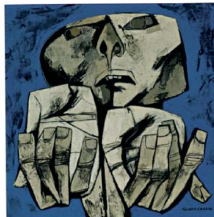
Oswaldo Guayasamin: Manos de un mendigo.