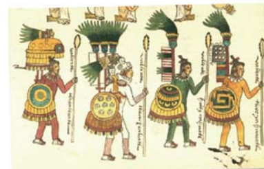
Códice Azteca, Civilización Azteca, México.