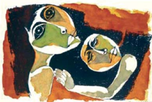
Oswaldo Guayasamin: Madre y niño.