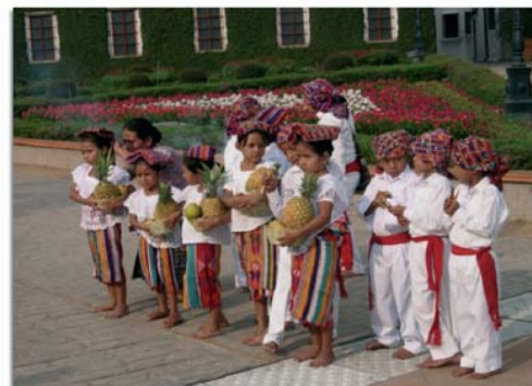
Niños y niñas maya en una ceremonia religiosa antes de la realización del Juego de Pelota Maya, abril de 2007.

estado de desarrollo de los pueblos originarios más conocidos de América: Maya, Azteca, Inca, Mapuche, Complejo Diaguita, Guaraní, Taino, Cola, Chibcha, Quechua, Xingu, etc., entre 1400 y 1500.