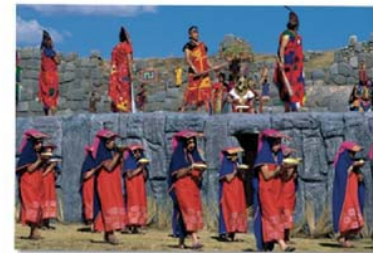
Fiesta del Inti Raymi, Perú