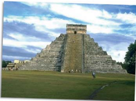
Pirámide maya, Civilización Maya, Yucatán.

meno mutuo y no una empresa llevada a cabo por los europeos. Tanto pueblos originarios como europeos descubrieron la existencia de algo desconocido, ni unos ni otros sabían de la existencia del otro diferente. Pero en este planteo es preciso tener en cuenta que los europeos, al advertir en los territorios antes desconocidos riquezas en recursos naturales, decidieron apropiarse de ellas. Esto reviste una importancia fundamental, porque permite entender que la conquista y colonización de América no fue un encuentro cultural o de identidades étnicas en el que se intercambiaron experiencias a partir del cual se inició un