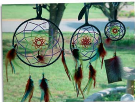
Atrapasueños, Culturas aborígenes de América del Norte